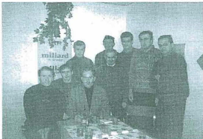
Zarząd Ligi Szóstek

Zarząd Ligi wprowadził również znaczące zmiany w regulaminie turnieju. Między innymi podwyższono granicę wieku dla zawodników z 16 do 20 lat (w zgłaszanych składach jest miejsce tylko dla dwóch piłkarzy urodzonych nie wcześniej niż w 1978 roku). Ponadto zniesiono zakaz uczestnictwa dla piłkarzy zrzeszonych w klubach sportowych. Ze względów organizacyjnych w lidze będzie mogło grać maksimum 12 drużyn. O zakwalifikowaniu, zdecydować kolejność zgłoszeń. Wpisowe w tym roku będzie wynosiło 15