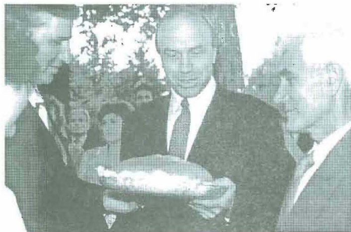
Bochen chleba do podziału otrzymali również gospodarze Gminy.

ściowe doświadczenie, mają lepszy osąd. Zachęcał, aby ci, którzy mają chleb, dzielili się z tymi, którym go brakuje. Przestrzegając, że do dobrobytu nie możemy iść po