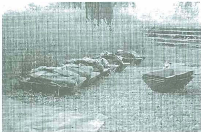
Na zdjęciu: Prochy umieszczano w małych tekturowych trumienkach.

Podziw osób przyglądających się pracom budzi precyzja z jaką odnajdywane są zrównane z ziemią żołnierskie mogiły. Jak