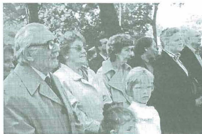
W uroczystości wzięły udział rodziny pomordowanych.