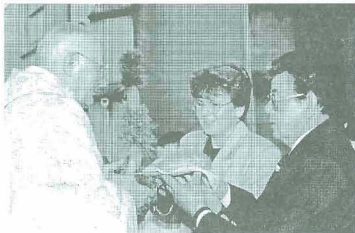
Starostwie dożynek wręczają bochen chleba ks. Dziekanowi.

cznościowej homilii kaznodzieja podkreślił rolę, jaką odegrali rolnicy w dziejach naszego kraju. Powiedział, że rolnik miał swoją dumę i swoją godność. Jakże czę-