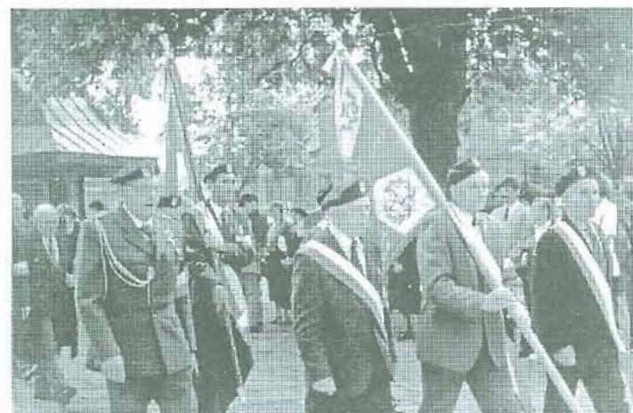
Przemarsz kombatanckich pocztów sztandarowych.

ich cześć wznoszone będą pomniki, ich imionami nazywane będą ulice, szkoły, zakłady pracy. Dziwna to jednak była wolność skoro o narodowych bohaterach nie wolno było mówić, a ci którzy przeżyli podlegali szykanom i to często wcale nie mniejszym od tych, które stały się ich udziałem ze strony germańskiego okupanta. Staraniem pozostałych po nich rodzin w wiele lat po wojnie na nasielskim kościele umieszczono w warunkach niemal konspiracyjnych niewielką tablicę, na której zabrakło nawet znaku - godła pod którym walczyli. Na skwerku miejskim w 1958 roku postawiono zaś niewiele mówiącą namiastkę pomnika.