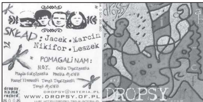
Okladkę zaprojektował basista zespołu - Leszek