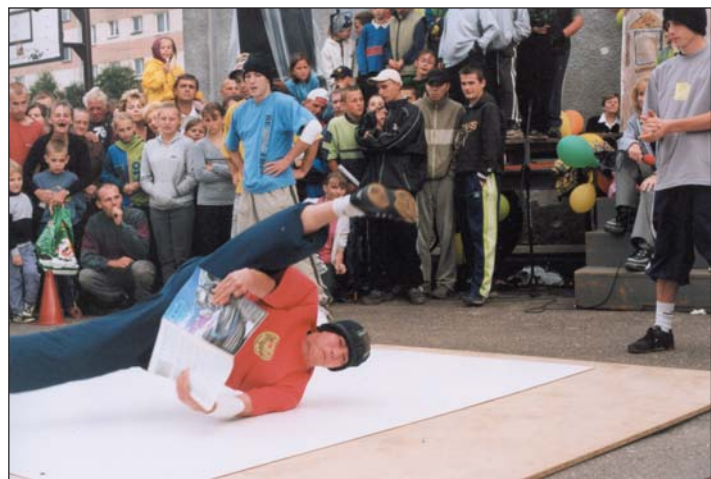
Zespół SCRAP BEAT zaprezentował nasielskiej publiczności taneczne obrotu na głowie, plecach, barkach, itd.

Kiedy w sobotę 29 czerwca w godzinach przedpołudniowych odbywały się ostatnie przygotowania do realizacji przewidzianych na ten dzień punktów programu, zastanawiano się czy nie odwołać