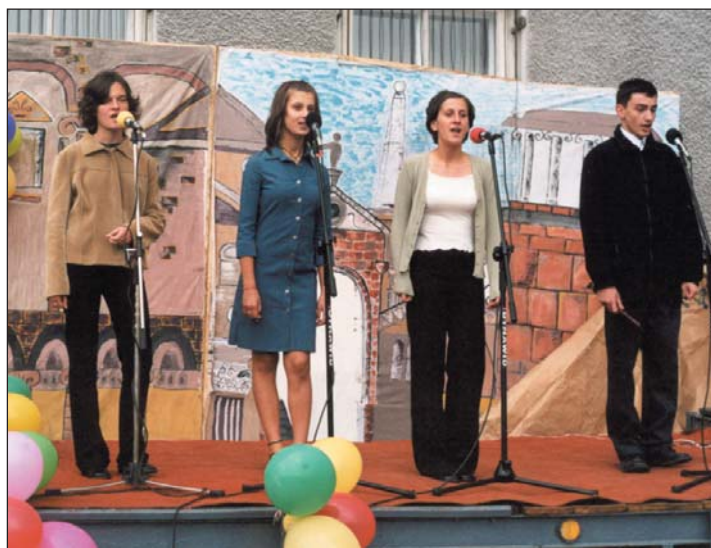
Występ zespołu ZA DROGĄ

W tym roku Dni Nasielska połączono z Parafiadą i Promocją Gminy - Chrcynno 2002. Samorządowe władze gminy powołały wspólny Komitet Organizacyjny. Imprezy odbyły się 29 i 30 czerwca.