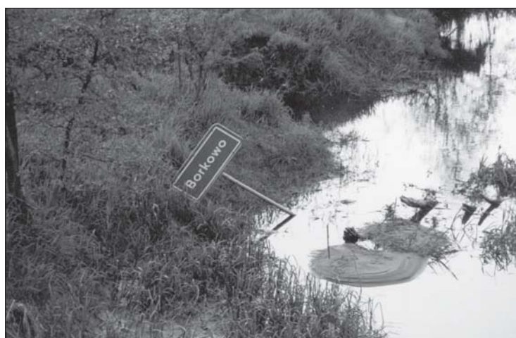
... drudzy rujnują