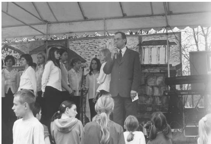
Okolicznościowe przemówienie związane z uchwaleniem Konstytucji 3 Maja wygłosił Burmistrz.

pamiętek historycznych w naszym mieście. Modernizacja drogi spowodowała potrzebę jej przemieszczenia. Ostatecznie figurka została rozebrana, a w jej miejsce wybudowano nową, można nawet powiedzieć, że prawie iden-