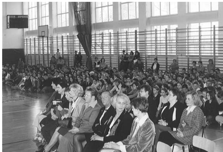
Forum Europejskie w Zespole Szkół nr1 w Nasielsku. Na pierwszym planie goście Forum Europejskiego.

W ten kontekst wpisało się znakomicie Forum Europejskie zorganizowane 29 Kwietnia 2003r. roku w Zespole Szkół Nr 1 w Nasielsku. Organizatorzy – nauczyciele i uczniowie – stanęli