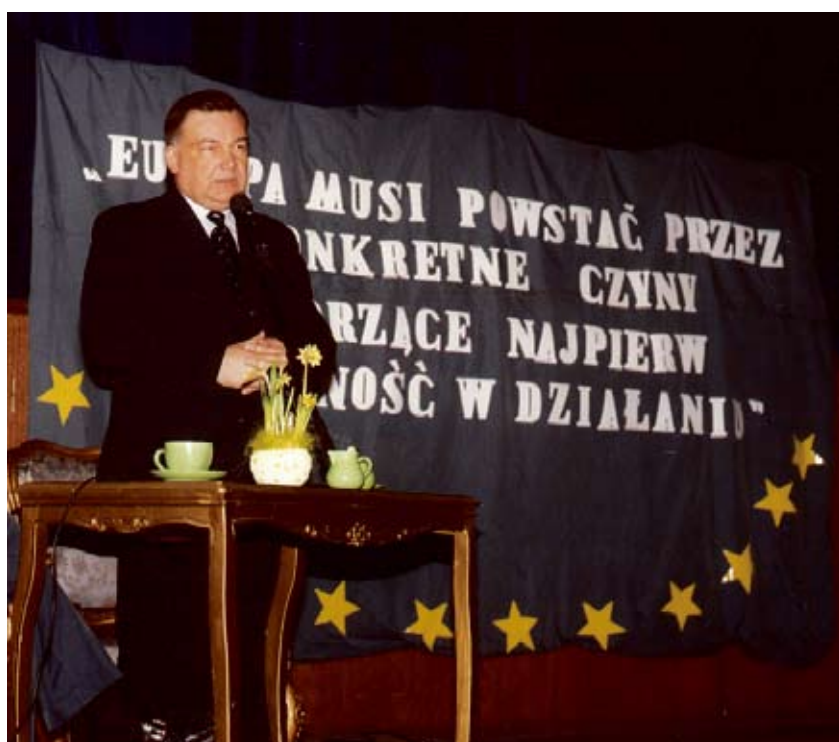
Marszałek Województwa Mazowieckiego gratulował Burmistrzowi i społeczeństwu gminy Nasielsk sukcesu.

jęty przez Komisję Europejską do realizacji projekt zatytułowany „Prawa warunków rozwoju sektora małych i średnich przedsiębiorstw