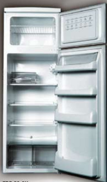
FDP 23-2H chłodziarko-zamrażarka