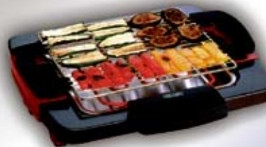
BQ 55 grill