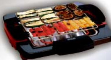
BQ 55 grill