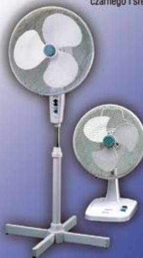
MVA 403 wentylator stojący