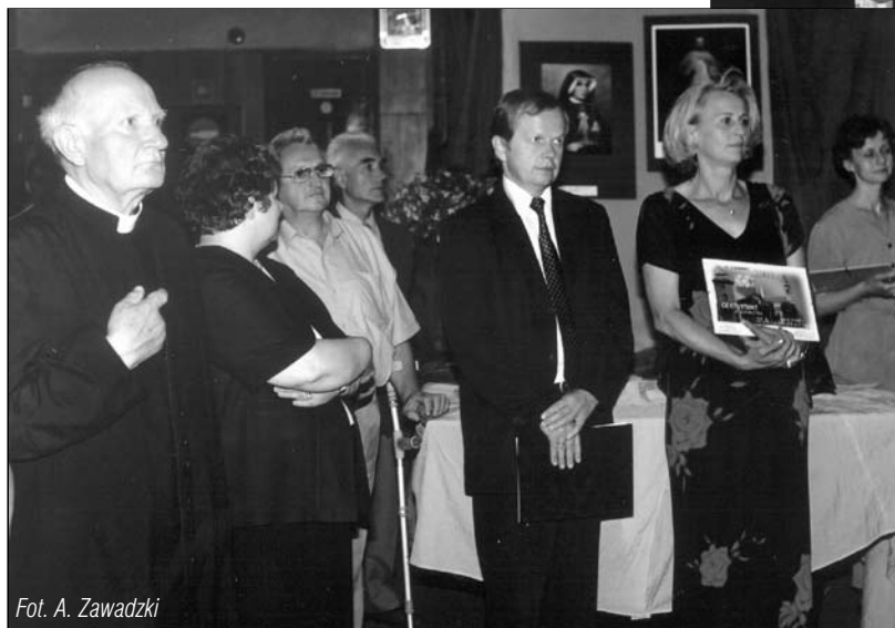
Otwarcie wystawy poświęconej Miłosierdziu Bożemu