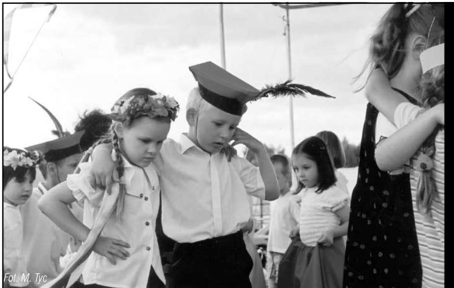
Tańczą dzieci z Przedszkola w Nasielsku