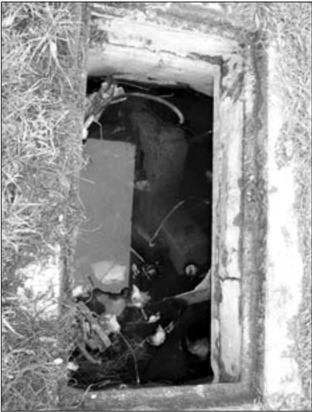
Tak wyglądała dziura 12 grudnia 2006 r.

O d kilku tygodni z uporem maniaka pokazujemy zdjęcia niebezpiecznego otworu w studziencie telekomunikacyjnej przy ulicy Koziej, bliżej Kościelnej. W nr 23 „Życia Nasielska” apelowaliśmy m.in. do firmy telekomunikacyjnej – nie wskazując jej nazwy – o zainteresowanie się dziurą. I mamy już pierwsze efekty naszej interwencji. Uderz w stół, a nożyce się odezwą.