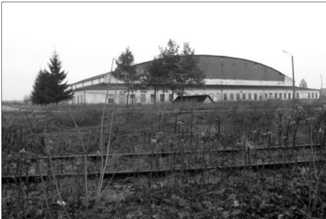
fol. D. Panasiuk

Eksperci dokonali analizy wszystkich projektów, które przeszły selekcję wstępną, tzn. nie miały charakteru lokalnego i kwalifikowały się do finansowania w ramach RPO. Każdy projekt oceniany był niezależnie przez dwie osoby – przedstawiciela Mazowieckiego Biura oraz Departamentu. Na podstawie tych ocen system komputerowy dokonywał wartościowania i wyznaczył ranking projektów. W przypadku rozbieżności ocen, na wspólnym posiedzeniu, cały