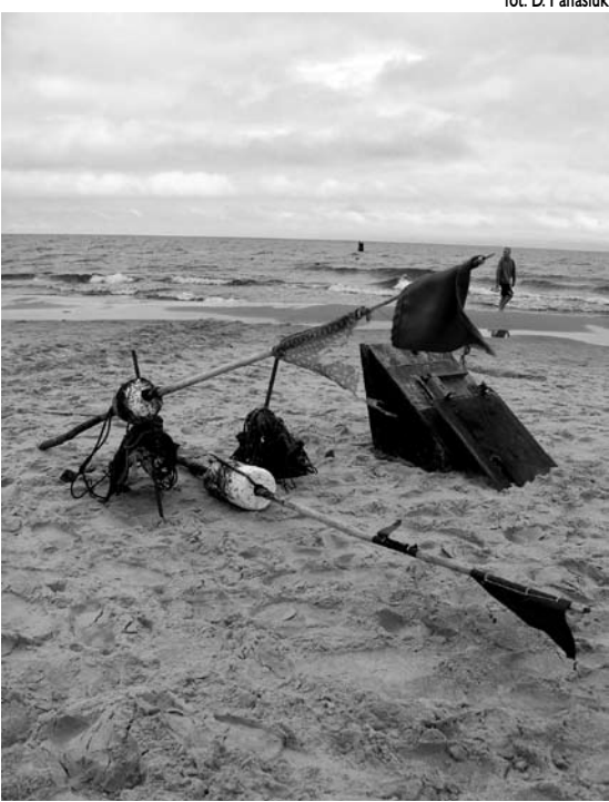
fol. D. Paniuk

Założenia Programu Operacyjnego 2007–2013 nie obejmują tworzenia agend przy urzędach marszałkowskich. Środki finansowe na realizację osi priorytetowej IV „Zrównoważony rozwój sektora rybołówstwa i nadbrzeżnych obszarów rybackich” przeznaczone zostaną na projekty realizowane przez Lokalne Grupy Rybackie na tzw. obszarach zależnych od rybactwa. Natomiast wdrażaniem