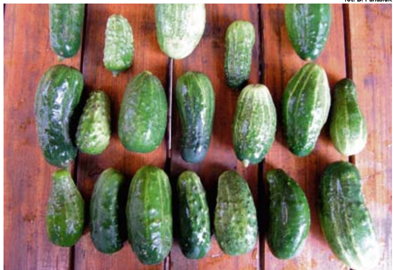
fol. D. Panasiuk

rzyw, w tym moreli, cebuli, groszku, marchwi i melonów. Komisja Europejska w ramach kompromisu, który ma pomóc przeforsować reformy, zgodziła się utrzymać dotychczasowe regulacje w wypadku 10 produktów ogrodniczych, między innymi pomidorów, jabłek, gruszek, truskawek, sałaty i kiwi.