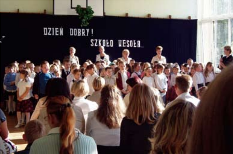
Akademia z okazji rozpoczęcia roku szkolnego w Szkole Podstawowej w Nasielsku.

W poniedziałek, 1 września uczniowie i nauczyciele uroczyscie powitali nowy rok szkolny. Tradycyjnie towarzyszyły temu mieszane uczucia. Niektórzy mieli miny co najmniej nietęgę, inny cieszyli się, bo szkoła to przecież nie tylko nauka, ale i życie towarzyskie. Najbardziej przejęci byli ci, którzy szkolne