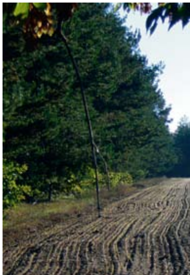
fol. D. Panasiuk

Następnie w terminie 21 dni od dnia wydania przez nadleśniczego zaświadczenia, ale nie później niż do