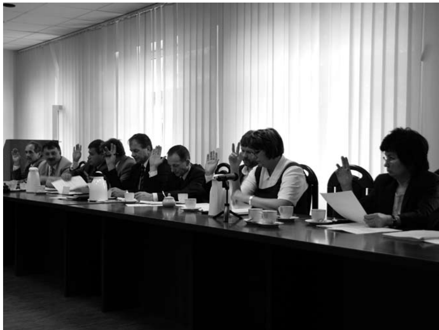
fol. M. Kordulewska

klas mają zakaz wstępu do toalet i że w tych toaletach nie ma drzwi. Apelował, aby zwiększyć obsadę nauczycieli na dyżurach lub zainstalować monitoring. Mówił również, że wśród nauczycieli tworzą się grupy, zapomina się o dobru dziecka. Zwracał uwagę na problem godzin