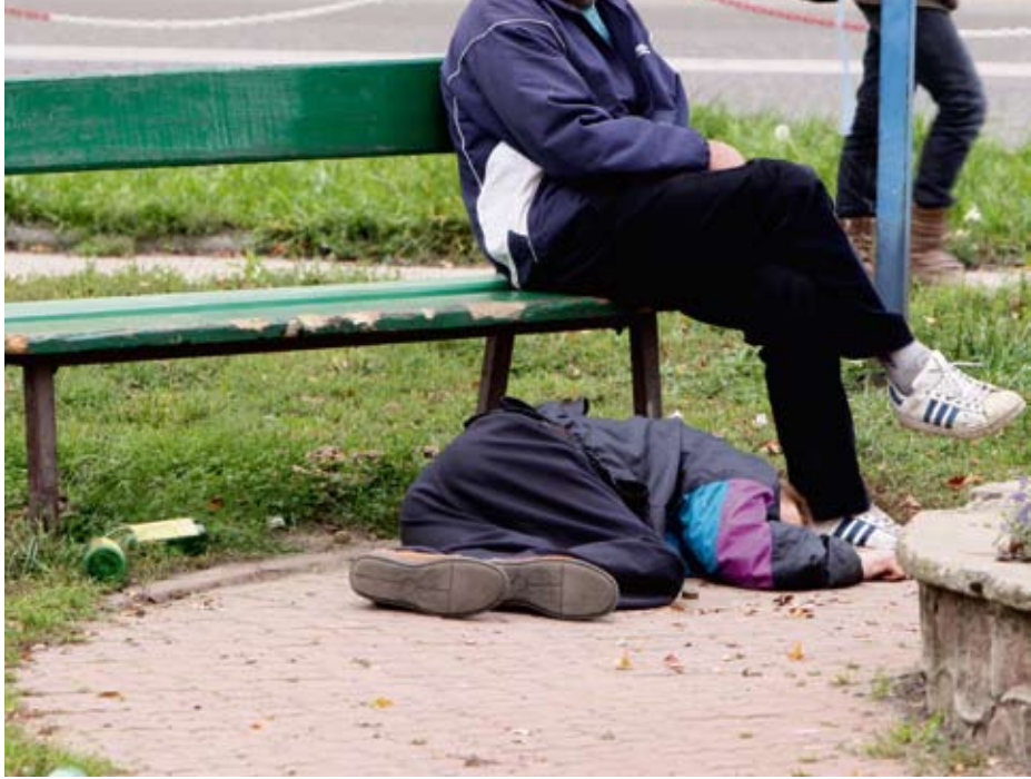
Zdjęcia otrzymaliśmy od jednego z naszych czytelników. Za komentarz do scenki niech posłuży data, czas i miejsce wykonania fotografii: piątek, 10 października, godziny 14.48 i 15.52, centrum Nasielska (skwer przy skrzyżowaniu ulic Warszawskiej, Kościuszki, Kilińskiego i Młynarskiej).