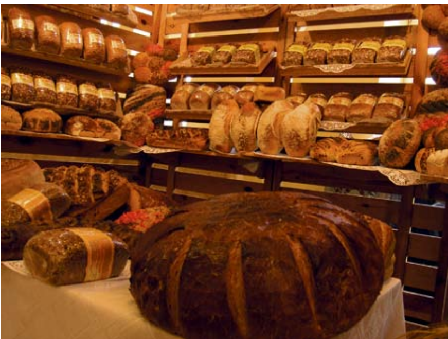
fol. D. Panasiuk