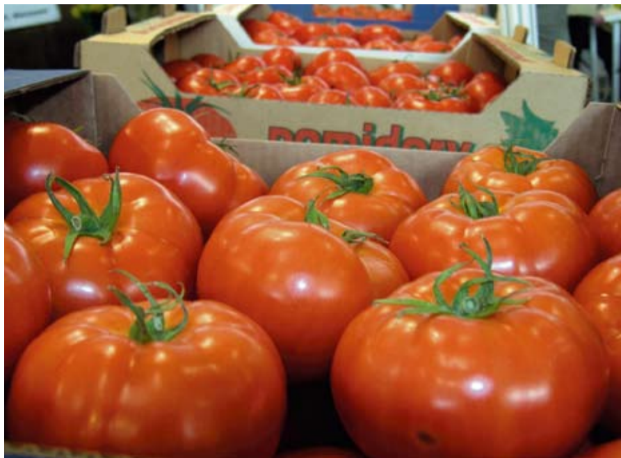
fol. D. Panasiuk

Na Warszawskim Rolno-Spożywczym Rynku Hurtowym