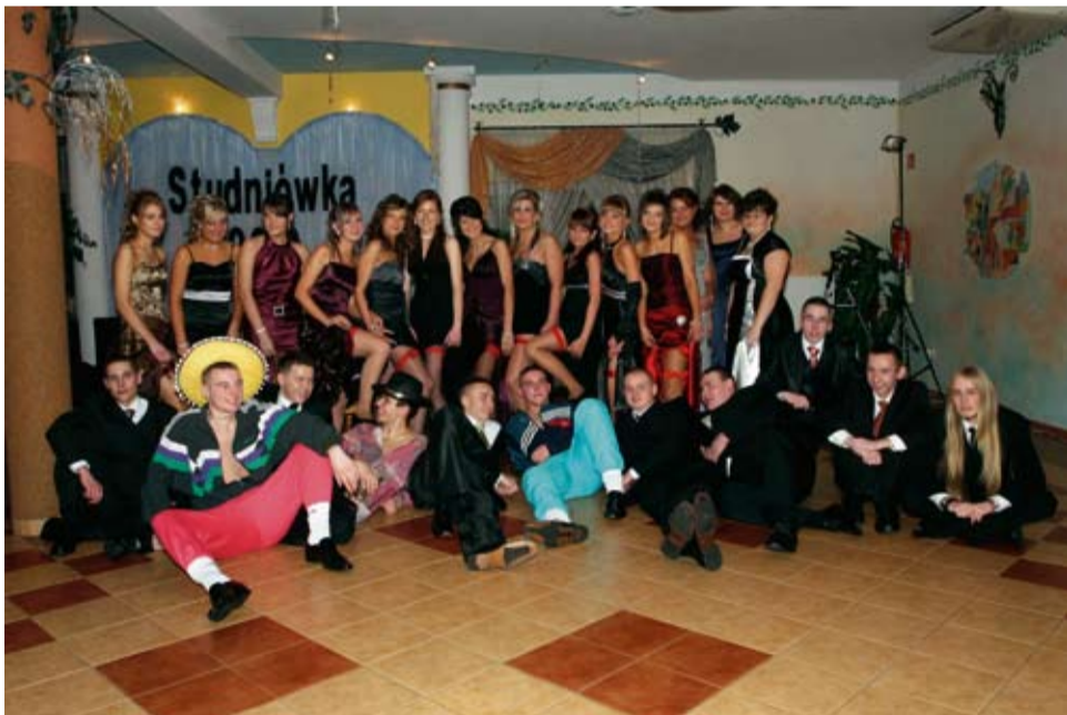
fol. A. Zawadzki