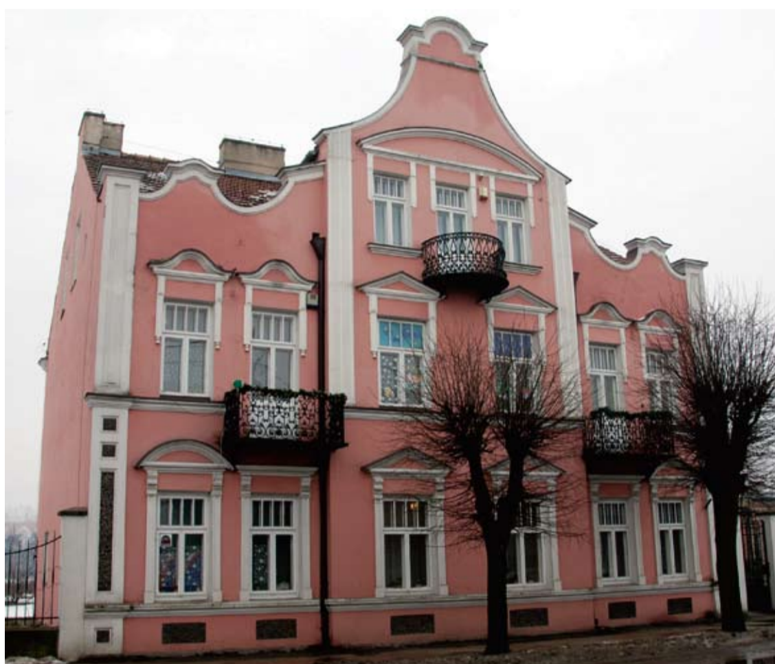
Niewykluczone, że w kwietniu, na tym budynku zawiśnie informacja, że mieści się tu siedziba nasielskiej Straży Miejskiej.