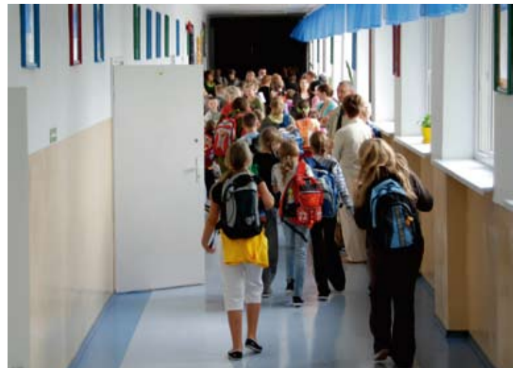
fot. M. Stamirowski