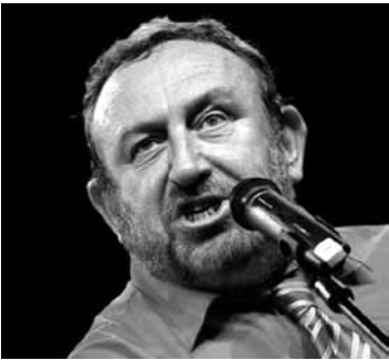
Wszystkich, którzy chcą miło spędzić czas, zapraszamy do NOK. (red.)

i prezentował program „Dyżurny Satyryk Kraju” w telewizji Polsat, później prowadził program „Śmiechu warte” w TVP1. Szczególną sympatią widzów cieszył się talk-show „Herbatka u Tadka” emitowany w TVP2 i TV Polonia. Bilety można nabywać już od 1 marca br. w Nasielskim Ośrodku Kultury. Ceny biletów: w przedsprzedaży – 25 zł, grupy zorganizowane (min. 20 osób) – 22 zł, zaś w dniu koncertu – 30 zł.