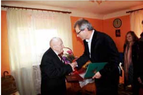
fort. UM Nasielsk