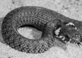
Zaskroniec zwyczajny ( Natrix natrix )

gnący się przez całą jej długość. Zdarzają się jednak osobniki całkowicie czarne. Zaskroniec zwyczajny jest natomiast ubarwiony bardziej jednolicie a na grzbiecie ma jedynie drobne, nieregularne plamki.