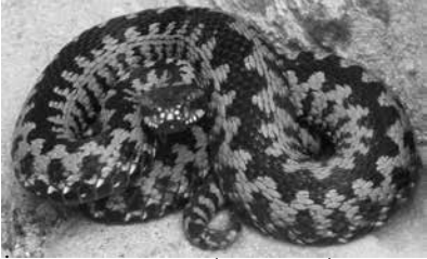
Żmija zygzakowata ( Vipera berus )

Żmija zygzakowata ma na grzbiecie charakterystyczny zygzak, cią-