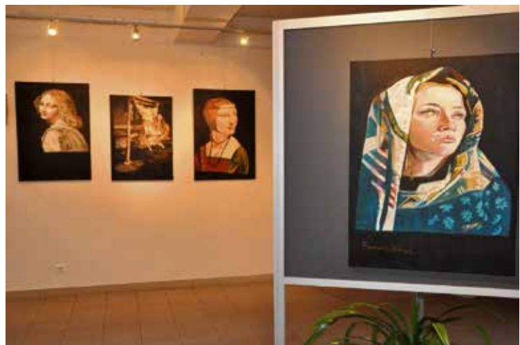
fot. Nowodworski Ośrodek Kultury

chał Anioł. Jak piszą organizatorzy jego wystawy: „W swej nowoczesnej interpretacji starożytnego malarstwa widać ślady doświadczenia, pomysłowość i malowanie techniką „know-how”, która staje się alchemicznym procesem, by przypomnieć światu, że „arcydzieło” istnieje i jest zbudowane krok po