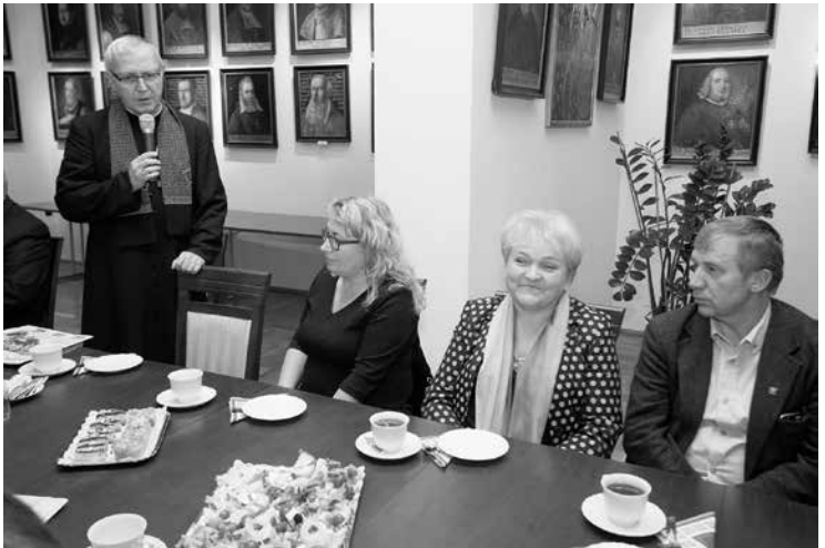
fol. T. Zawadzki

Ksiądz biskup przyjął swych gości, a było ich ponad czterdziestu, w Sali Biskupów Płockich Opactwa Pobenedyktynskiego mieszczącego się tuż