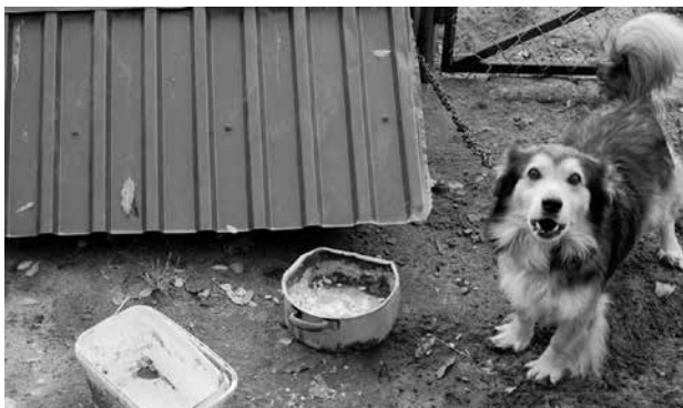
Kątne, pies na 70 cm łańcuchu, ziemianka zamiast budy, w czasie deszczu błoto spływa do bud. Pies nigdy nie spuszcza z łańcucha.

canych łańcuchach przez całe życie. Rzadko albo w ogóle nie są z nich spuszczone. Nie mają dostępu do świeżej wody, a karmione są często chlebem z wodą i resztkami z obiadu lub kośćmi.