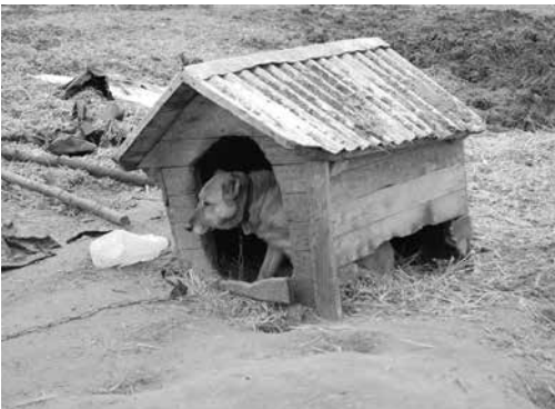
Suczka uwiązana w szczerym polu w Paulinowie – w dzień i w nocy miała bronić kopca z sianokiszonką przed dzikami.