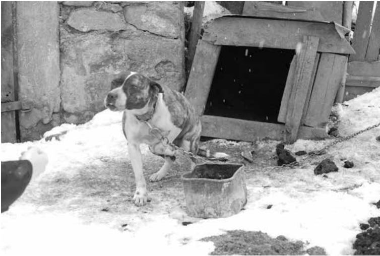
Cegielnia Psucka, 5 psów żyje tu w tragicznych warunkach.

– Spotykam się z brakiem świadomości o konieczności i zaletach sterylizacji, ludzie mówią, że nie chcą zwierzętom robić krzywdy. Nie usypiają też ślepego miotu, choć można to zrobić bezpłatnie w schronisku – relacjonuje pani inspektor OTOZ Animals. – W fatalnym stanie są budy, w których mieszkają psy. Często na zimę psiaki mają w nich tylko