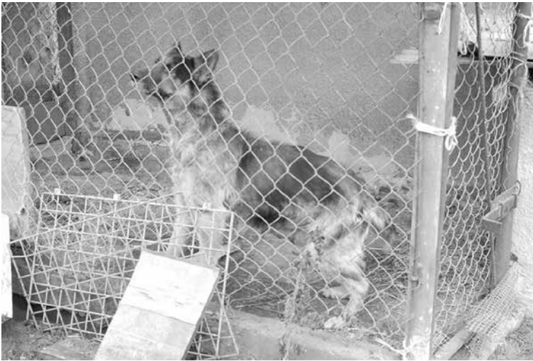
Starszy owczarek w Kątnych, ogromny guz jader, grzybica, anemia, kajec pełen odchodów, wody brak, bo „pił wczoraj”. Pies odebrany właścicielowi.

– Prośby o interwencję dostajemy od osób z całej gminy Nasielsk. Najczęściej dostajemy je od tych, którzy widzą krzywdę zwierząt, nie