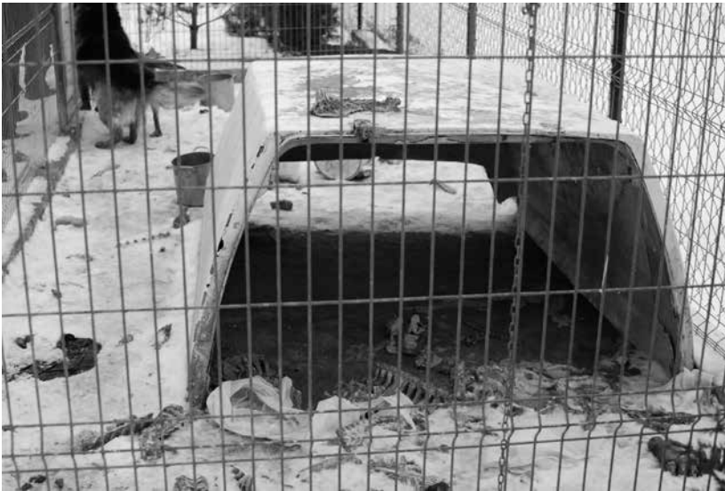
Interwencja w Nasielsku, 15 stycznia br., -15 stopni C, buda z dachu samochodu, a zamiast podłogi beton. Kości w reklamówkach, z kilku miesięcy, pełno odchodów, jednodniowe szczenięta (3 zamrożone, 2 jeszcze żywe, ale przemrożone)

Warto na każdym kroku przypominać, że zwierzęta, to istoty żywe, odczuwające ból i głód podobnie jak ludzie.