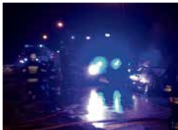
fort. OSP Nasielsk

W niedzielę 22.01 około godziny 22:00 strażacy z OSP Nasielsk zostali zadysponowani do pożaru samochodu osobowego BMW na ul. Warszawskiej. Na miejscu obecne były patrol policji i zespół ratownictwa medycznego, który zajął się poszkodowanym kierowcą. W akcji udział brały również zastępy z OSP Jackowo i JRG Nowym Dwór Mazowiecki.