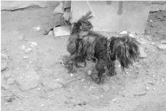
Mazewo Dworskie, pies na kilku łańcuchach, zaniedbany.