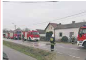
fot. OSP Nasielsk

13 listopada dachowanie sa- mochodu osobowego w miej- scowości Wągrowo. Do akcji zadysponowano zastępy z OSP Psucin, OSP Nasielsk i PSP Nowy Dwór Mazowiecki.